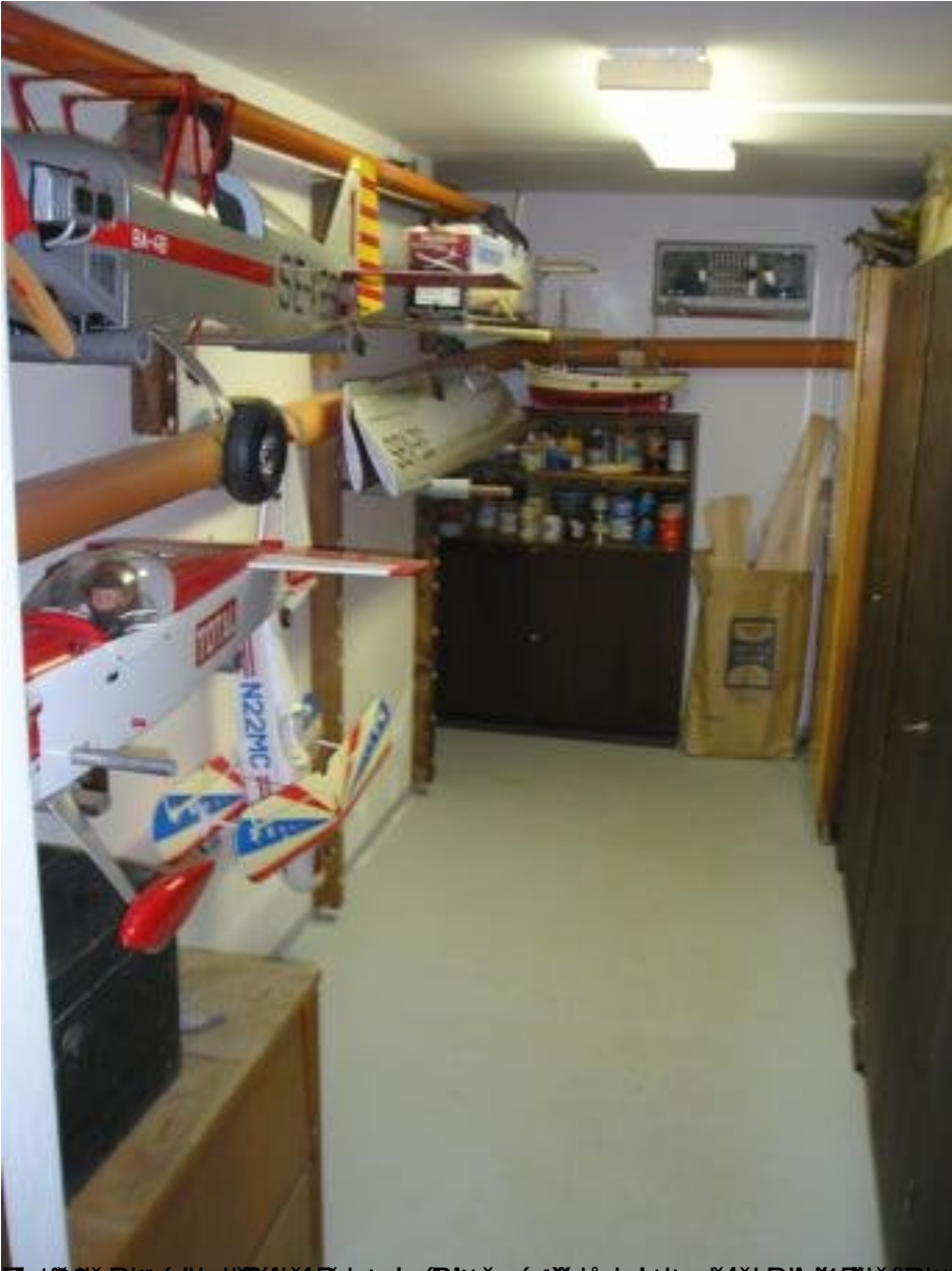
Zobrazuje modely letadel, které jsou v muzeu umístěny. Jsou to například letadlo BA-6 a letadlo NZZMC. V muzeu jsou také umístěny různé nástroje a přístroje, které byly použity při stavbě těchto letadel. Muzeum je umístěno v Praze a je přístupné veřejnosti.