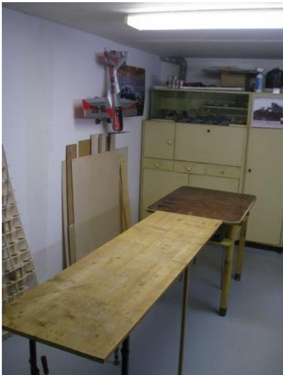
Třetí místnost slouží jako skladiště a hangar, trošku uložené historie...