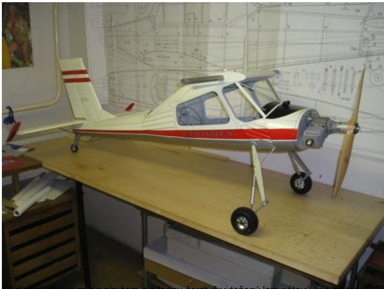
křídla stříkla zatím jen plnicím a z formy čerstvě vytažený laminátový kryt motoru.