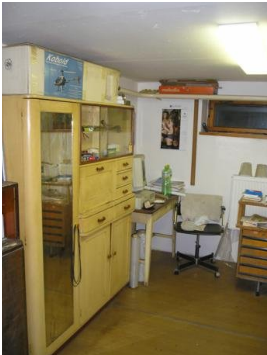
Druhá místnost slouží na hrubší práce:řezání,broušení,vrtání,laminování atd.