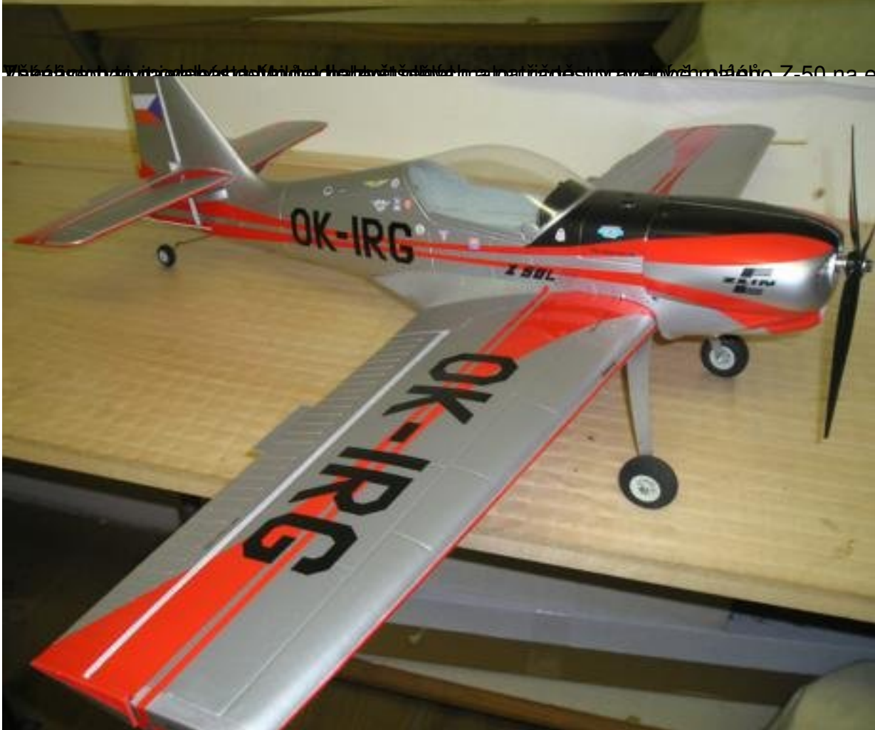
WiSe 2015/2016, ústřední úkol, Křídla, Heleň, dvířka, motor, nádrž, síť, anemometr, měřič 7-50 na el. motor.