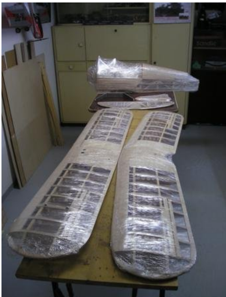
Také dušička je od Wilze. Rozpětí má 2350mm a motor ZDZ 40RV. Na Wilze už moc