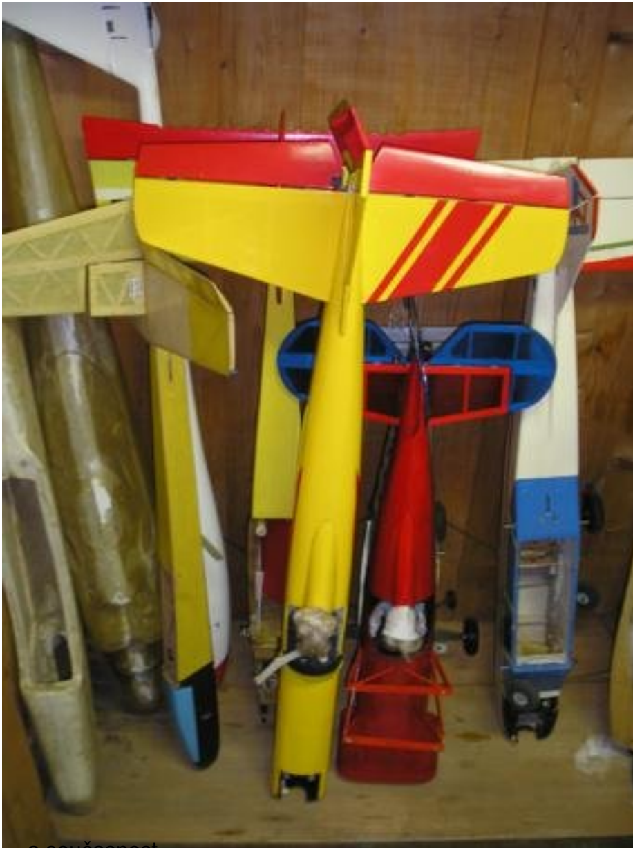
... a současnost